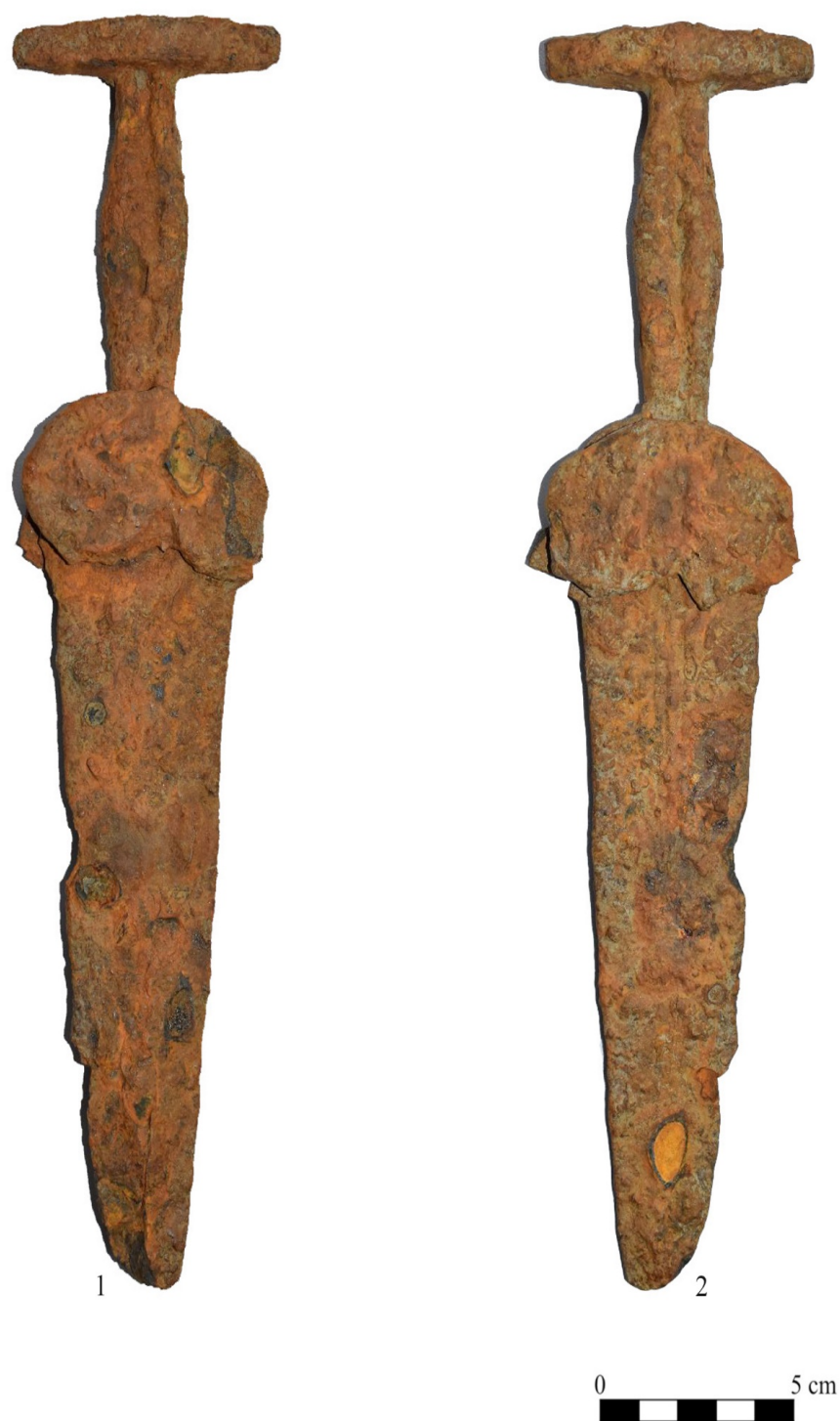
Plansa III. Fotografii ale pumnalului de tip Akinakes descoperit în pădurea de la Curcubeu, com. Balta Doamnei: 1 - fața nedecorată; 2 - fața decorată.

Photographs of the Akinakes type dagger discovered in the Curcubeu forest, Balta Doamnei commune: 1 - undecorated side; 2 - the decorated side.