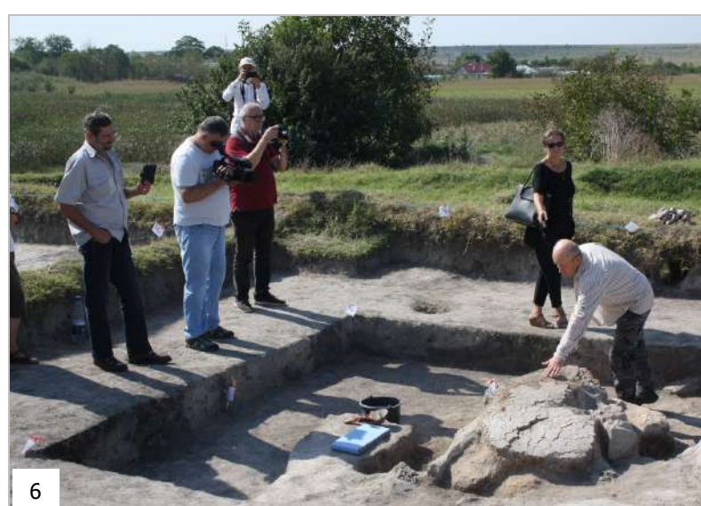
Vitănești 'Măgurice', cu ocazia unor 'Zile ale Porților Deschise': 2009 (1, 2), 2018 (3-6).