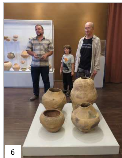
Moment aniversar - 25 de ani de la începutul cercetărilor arheologice de la Vitănești 'Măgurice', MJT - 11 septembrie 2018.