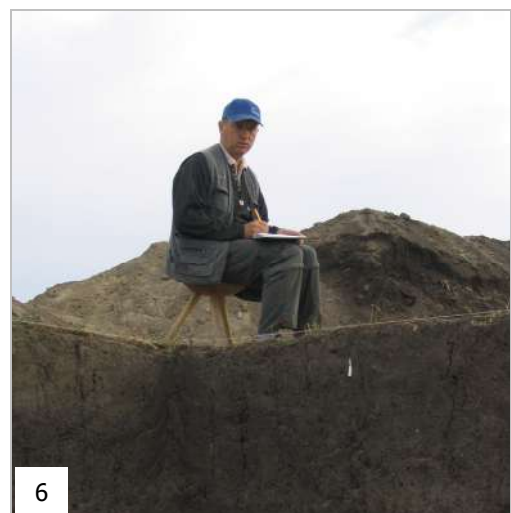
Pe șantierul de la Măgura 'Buduiasca', în cadrul SRAP: 2003 (1, 2), 2004 (3-6).