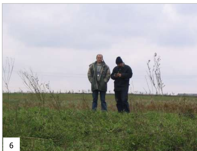
Periegheze prin Teleorman: Lăceni 'Cioroica' - 1997 (1), Tătărăștii de Jos 'Țurești' - 1999 (2), Dudu, pe terasa estică a Oltului - 2001 (3), Poroschia 'Râpe' - 2001 (4), Balaci 'Hodorog' - 2003 (5), pe valea Nanovului - 2005 (6).