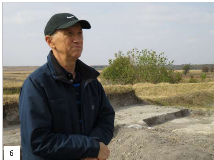
Vitănești, instantanee pe tel- ul 'Măgurice': 2013 (5), 2018 (1, 6), 2019 (2-4).