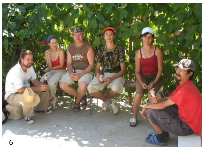
Momente de relaxare... prin Alexandria - 1999 (1), 2002 (2), de 'Zilele Alexandriei', la Hotel Parc - 2003 (3), pregătind un grătar la muzeu - 2004 (4), de ziua de naștere, la Alexandria - 2004 (5), la finalul unei zile de muncă, la Vitănești - 2007 (6).