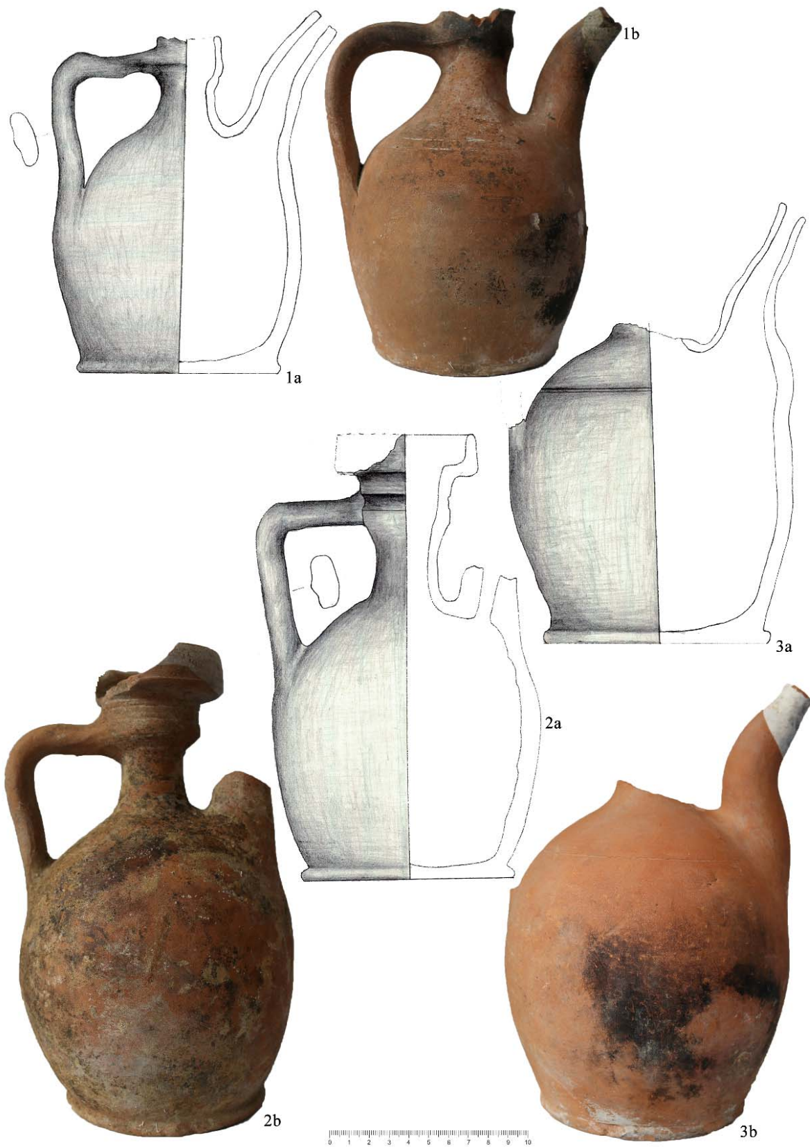
Planșa V. Urchioare (1-3: sec. XVII-XVIII sau mai târziu) Jugs (1-3: 17 th -18 th centuries or later).