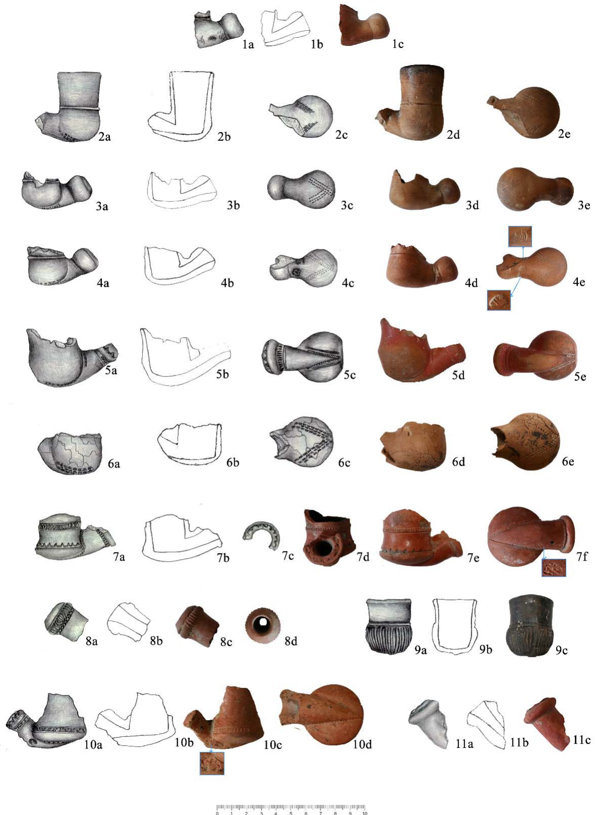
Plansa II. Pipe de lut (1-4, 6-7: a doua jumătate a sec. XVIII; 5, 11: începutul sec. XIX; 8-9: sec. XIX; 10: a doua jumătate a sec. XVIII, sec. XIX).

Smoking clay pipes (1-4, 6-7: the second half of the 18 th century; 5, 11: early 19 th century; 8-9: 19 th century; 10: second half of the 18 th century, 19 th century).