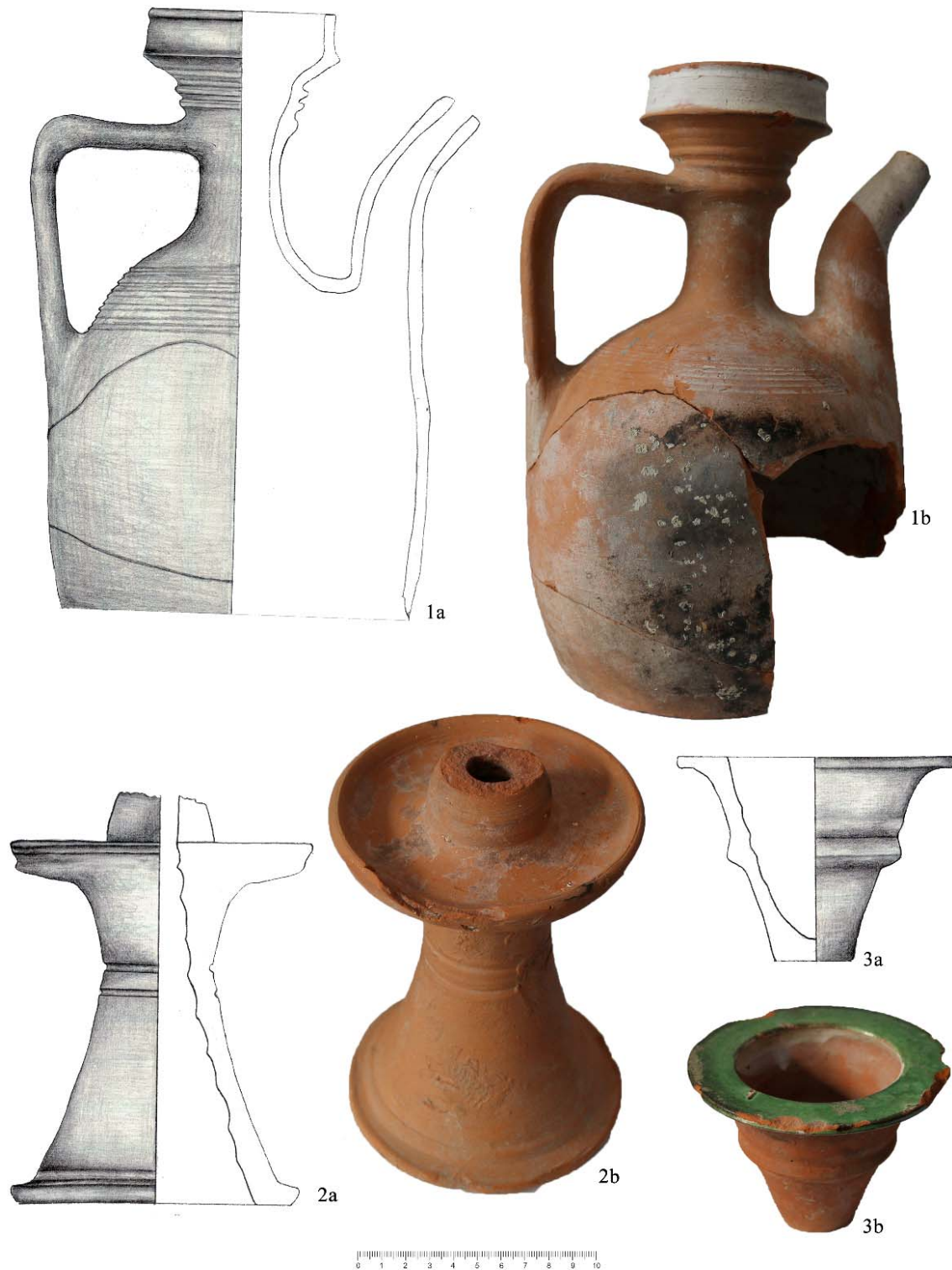
Plansa VI. Urcior (1a-b: sec. XVII-XVIII sau mai târziu); sfeșnic (2a-b: sec. XVII-XVIII); cahlă pentru sobele de încălzit (3a-b: sec. XVII-XVIII).

Jug (1a-b: 17 th -18 th centuries or later); candlestick (2a-b: 17 th -18 th centuries); stove tile (3a-b: 17 th -18 th centuries).