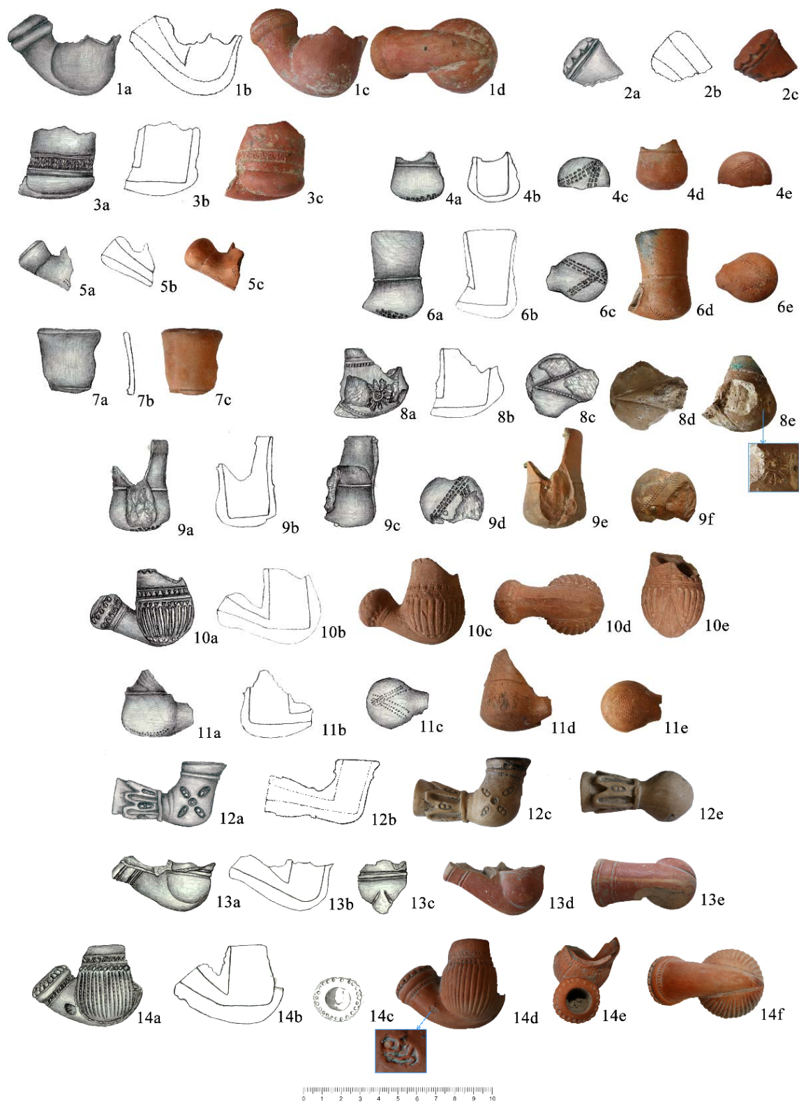
Plansa III. Pipe de lut (1-2: începutul sec. XIX; 3-7, 9, 11: a doua jumătate a sec. XVIII; 8: sfârșitul sec. XVIII; 10, 14: sec. XVIII, XIX; 12: sec. XVIII; 13: a doua jumătate a sec. XVIII, sec. XIX).

Smoking clay pipes (1-2: early 19 th century; 3-7, 9, 11: second half of the 18 th century; 8: late 18 th ; 10, 14: 18 th -19 th centuries; 12: 18 th century; 13: second half of the 18 th century, 19 th century).